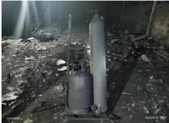
图 2 事故现场的液化气瓶和氧气瓶