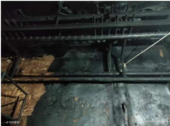
图 6 冷却间里屋顶焊割剩余的旧管道