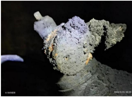
图4被烧坏的氧气瓶瓶口