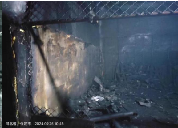
图 7 未完全割除的网栅