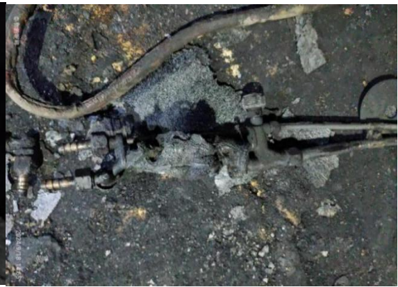
图5事故现场的液化气瓶和氧气瓶的焊把线