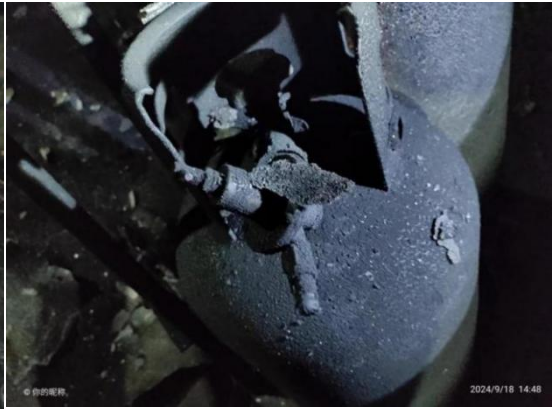
图 3 被烧坏的液化气瓶